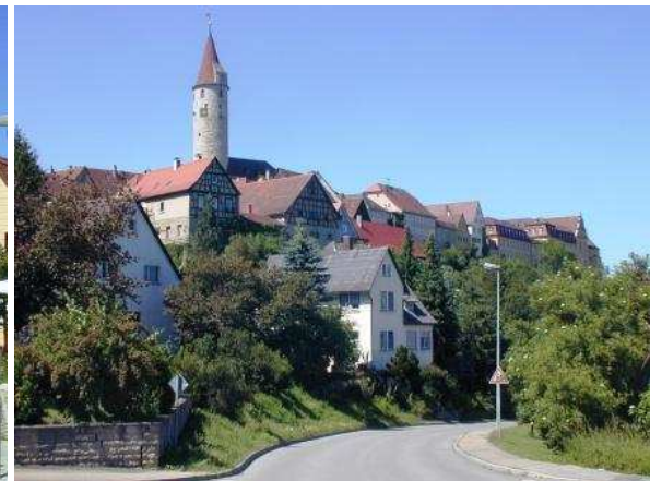
Kirchberg an der Jagst