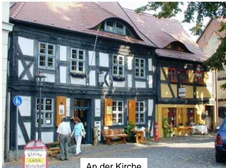
An der Kirche