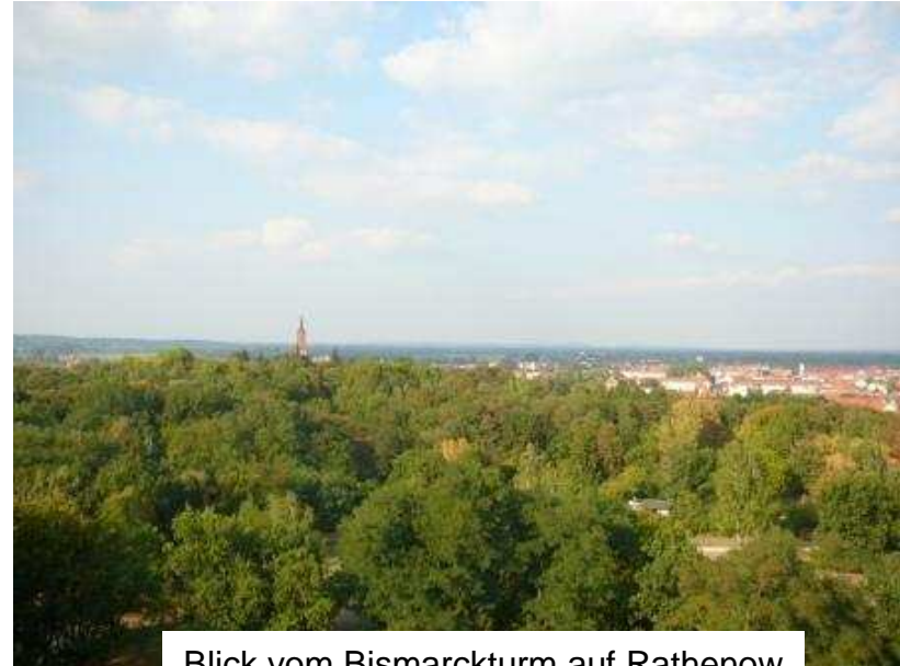
Blick vom Bismarckturm auf Rathenow