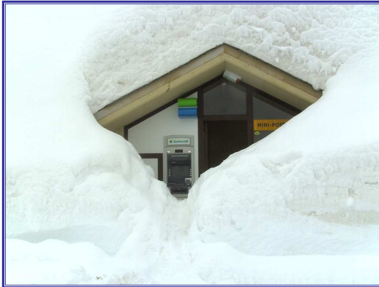
Der einzige Geldautomat auf dem Nassfeld